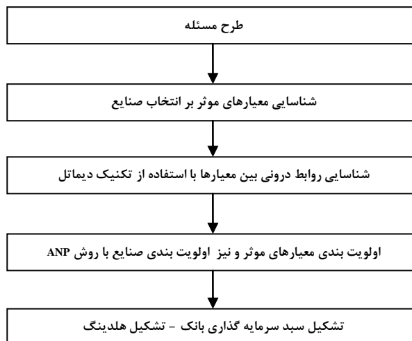
شکل ۱: مراحل اجرای تحقیق