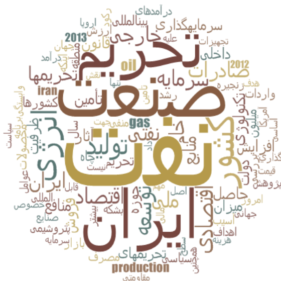
شکل ۳: لغات پرتکرار به کاررفته در منابع تحقیق

خود را بفروشیم و پولش را نیز به کشور بیاوریم اما همین تبادل هزینه‌ای بسیار بیشتر از یک تبادل عادی دارد و از این رو تحریم برای کشور بسیار هزینه‌زاست و ما امیدواریم دولت جدید راهی برای برون رفت از آن پیدا کند. عملیات کدگذاری برای سایر تحقیقات نیز به همین منوال با کمک نرم‌افزار Nvivo صورت گرفت. تصویر زیر نشان‌دهنده لغات پرتکرار (Word Frequency) در منابع موجود است که با کمک نرم‌افزار Nvivo استخراج شده است.