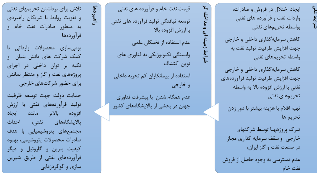
شکل ۴: الگوی پارادایمی نشان‌دهنده شرایط علی، زمینه‌ای و مداخله‌ای در زنجیره تأمین صنعت نفت ایران

قیمت نفت و فرآورده‌های نفتی اگر بالا باشد با فرض کاهش فروش نفت ممکن است درآمد حاصل از فروش کاهش نیابد. به عبارت دیگر پایین بودن قیمت نفت اثر تحریم‌ها را بر صنعت نفت ایران افزایش می‌دهد؛ بنابراین یکی از عوامل مداخله‌گر که شدت اثر تحریم‌ها را مشخص می‌کند بحث قیمت نفت و فرآورده‌های نفتی است.